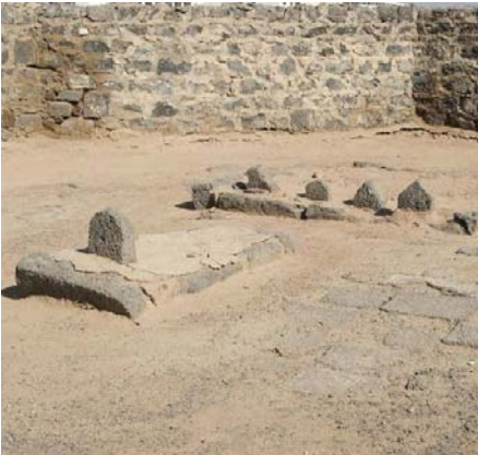
کلمات قصار، پندها و حکمت‌ها، ص ۸۵ – ۶۵

محدود شود؛ بلکه باید فرصتی باشد برای طرح مجدد مسأله بقیع در فضای اسلامی و بین‌المللی و مطالبه حقوق مسلمانان در بازسازی این اماکن مقدس.