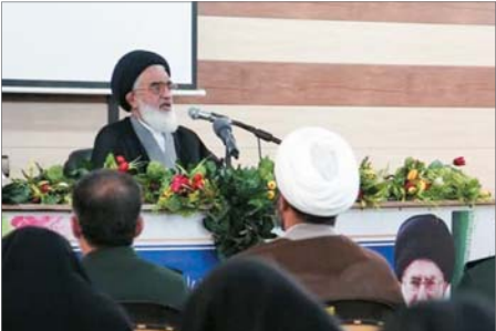
گزارش: داوود مظاهری

افراد ناآگاه و فریب‌خوردگان از حقایق آگاه شوند و به دامن این نظام و انقلاب برگردند.