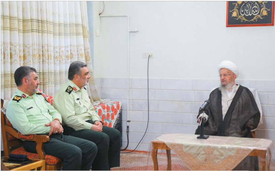
مراجع عظام تقلید و علما در دیدار فرمانده فراجا