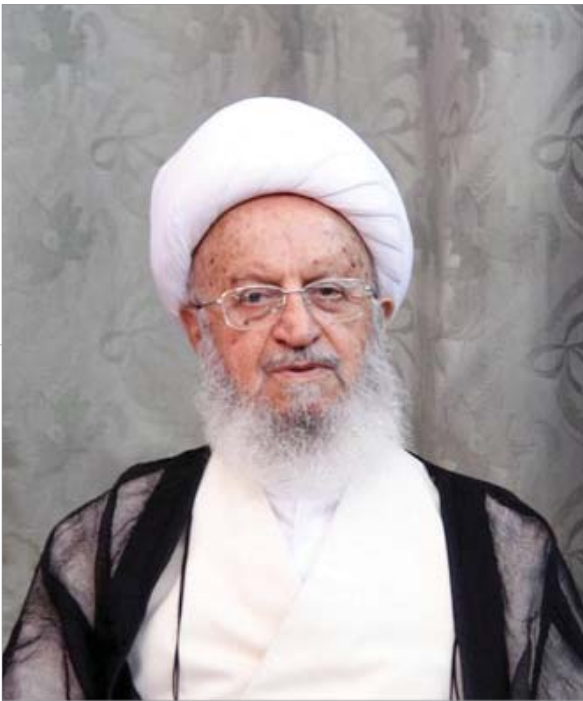
صحیفه امام، ج ۱، ص ۱۶۳

در نصرت مؤمنان تحقیق یافته و خواهد یافت و به‌زودی پیروزی آشکار اسلام و شکست خفت‌بار جبهه کفر بیش از پیش نمایان خواهد شد و اوج این نصرت الهی نیز با ظهور حضرت ولی‌عصر ارواحنا فداء و تحقیق حکومت جهانی عدل و توحید رقم خواهد خورد إن‌شاءالله تعالی.