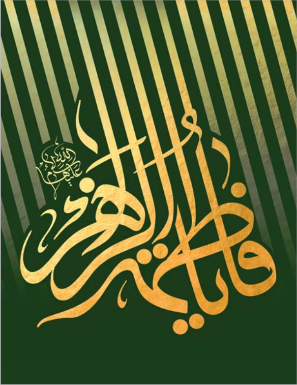
فاطمه زهرا (علیها) در سیره حضرت فاطمه زهرا (علیها)

یکی از مؤثرترین روش‌های احیای امر ولایت و افشای ظلم، گریه‌های سوزناک و هدفمند حضرت زهرا (علیها) بود. این گریه‌ها صرفاً یک واکنش عاطفی نبود؛ بلکه یک ابزار سیاسی و اجتماعی قوی و معنادار برای جریحه‌دارکردن وجدان جامعه بود. گریه‌های ایشان در أحد (بر سر قبر حمزه سیدالشهدا (علیه) ) و در بیت‌الاحزان (کلبه‌ای که