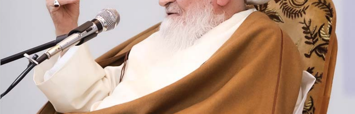
ادامه از صفحه اول ویژه‌نامه