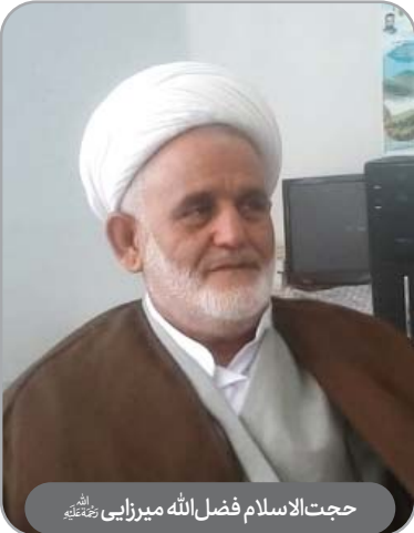
حجت‌الاسلام فضل‌الله میرزایی رحمته‌اللهه