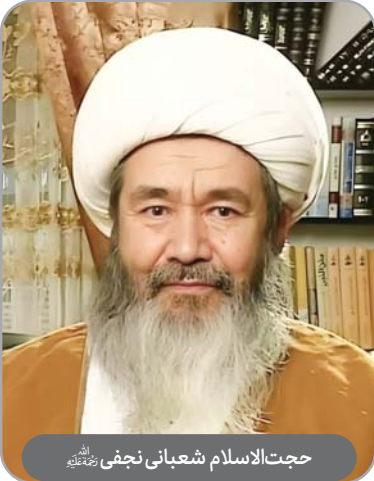
حجت‌الاسلام شعبانی نجفی رحمته‌اللهه