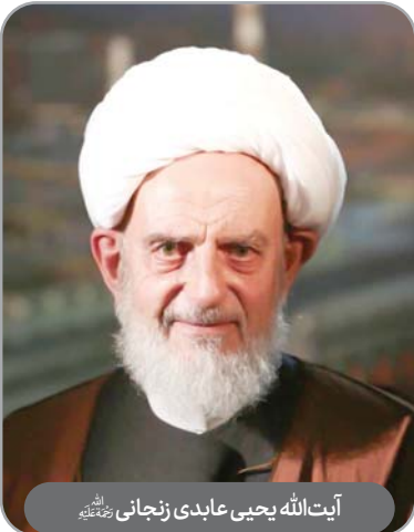
آیت‌الله یحیی عابدی زنجانى رحمته‌اللهه