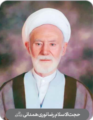
حجت‌الاسلام رضانوری همدانی رحمته‌اللهه