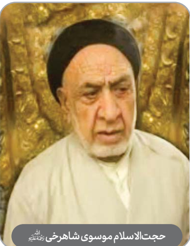
حجت‌الاسلام موسوی شاهرخی رحمته‌اللهه