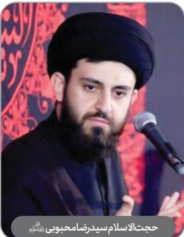
حجت‌الاسلام سیدرضا محبوبی رحمته‌اللهه