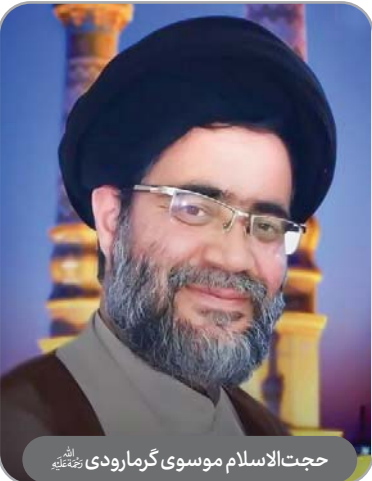
حجت‌الاسلام موسوی گرمارودی رحمته‌اللهه