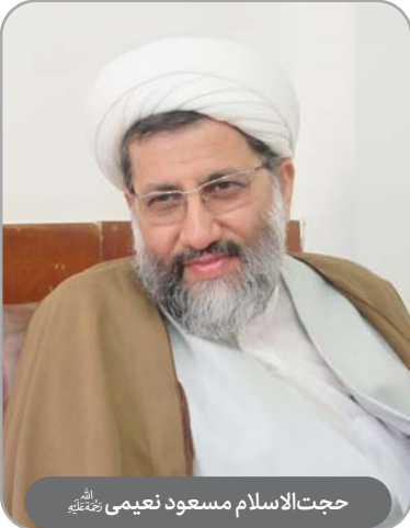
حجت‌الاسلام مسعود نعیمی رحمته‌اللهه