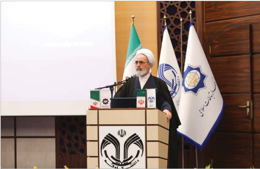
آیت‌الله اعرافی در دانشگاه قم

وی همچنین گفت: این همایش در حوزه دیپلماسی پژوهشی نقش بسزایی در پیشبرد اهداف متعالی اسلام دارد و می‌تواند، نهادهای علمی جهان اسلام را به توسعه ارتباطات گسترده و شرکت در گفت‌وگوهای کاربردی و علمی هدایت کند.