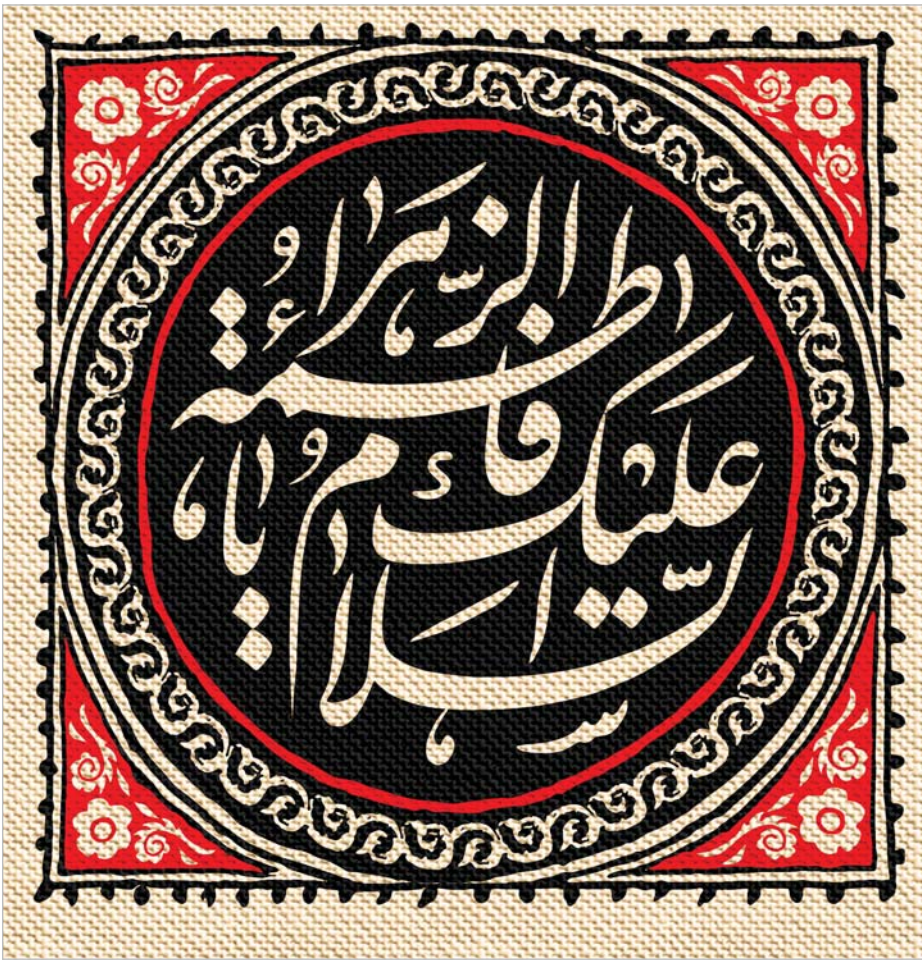
صحیفه امام علیه السلام ، ج۲، ص ۳۲۷

فَبِكُمْ التَّقْلِيلُ: كِتَابَ اللَّهِ وَعِزَّتِي، مَا إِنَّ تَسَكُّتَكُمْ بِهَذَا لَنْ تَصِلُوا بِغَدَى أَتَدَا.