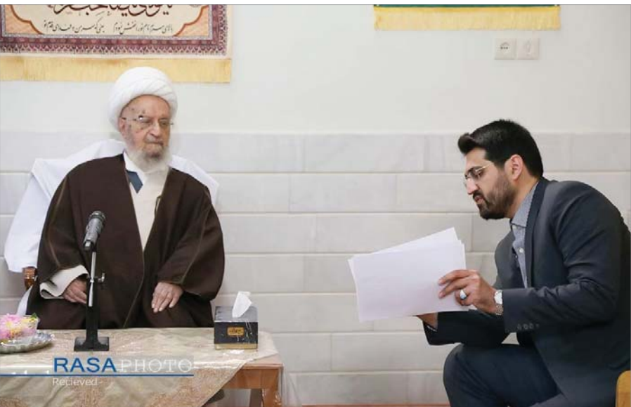
بحر الآوار، العلامة المجلسی، ج ۱۳، الصفحة ۳۲۳

امیرالمؤمنین علیه السلام همیشه می فرمود: این امت همیشه در نیک بختی به سر برند تا وقتی که لباس بیگانگان را نپوشند و غذای بیگانگان را نخورند؛ اما وقتی چنین کردند خداوند آنان را به خواری اندازد.