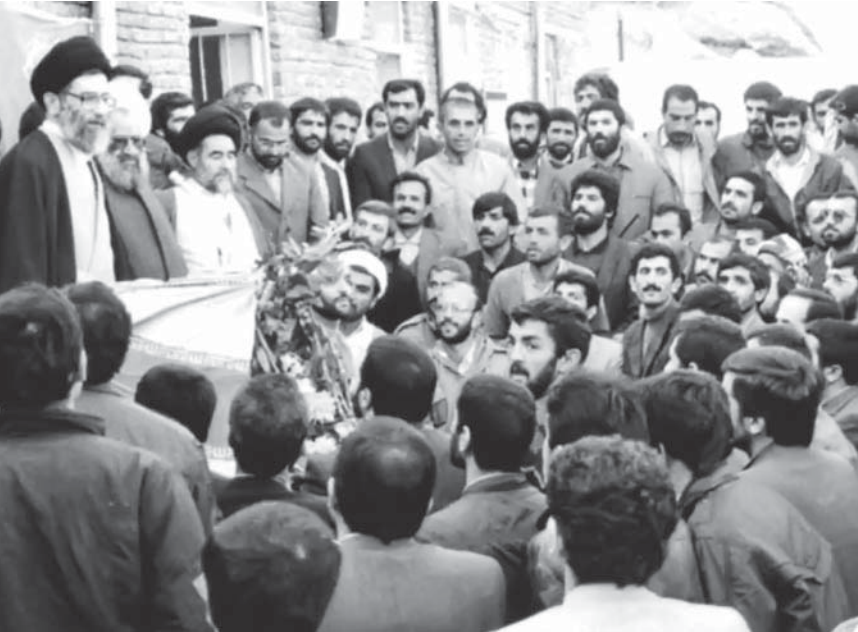
به‌مناسبت دهمین سالگرد آیت‌الله مسلم ملکوتی رحمۃ‌الله‌علیه