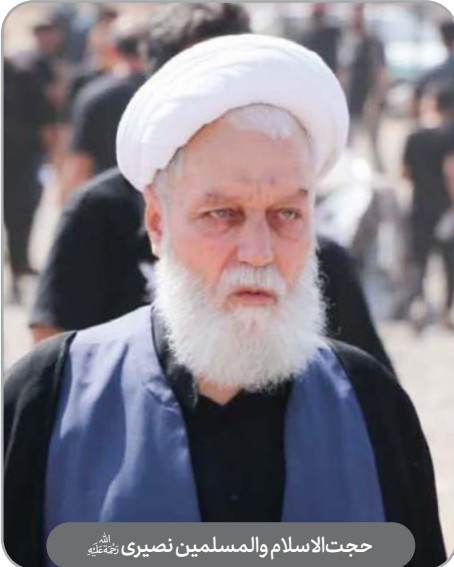
حجت‌الاسلام والمسلمین نصیری رحمته‌الله