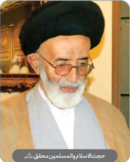
حجت‌الاسلام والمسلمین محقق رحمته‌الله