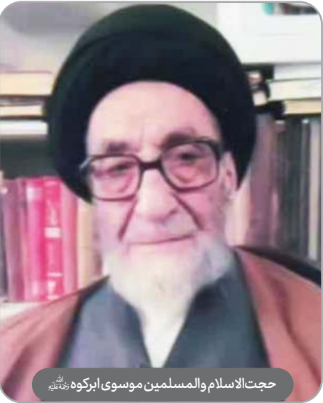
حجت‌الاسلام والمسلمین موسوی ابرکوه رحمته‌الله

بعد از پیروزی انقلاب در نهاد نمایندگی ولی‌فقیه و سازمان عقیدتی سیاسی وزارت دفاع به تدریس، سخنرانی و اقامه جماعت اهتمام ورزید.