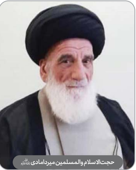
حجت‌الاسلام والمسلمین میردامادی رحمته‌الله