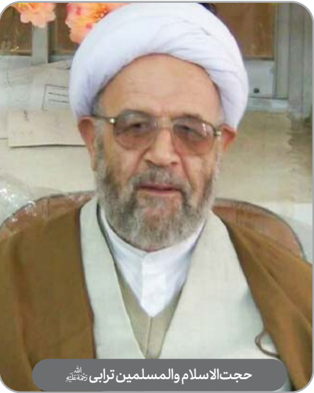
حجت‌الاسلام والمسلمین ترابی رحمته‌الله