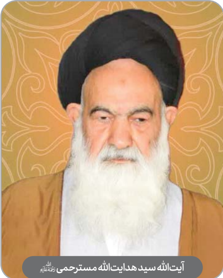
آیت‌الله سید هدایت‌الله مسترحمی رحمته‌الله