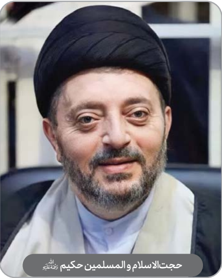
حجت‌الاسلام والمسلمین حکیم رحمته‌الله

او در خمینی‌شهر خدمات اجتماعی فراوانی از جمله تأسیس مؤسسات خیریه و صندوق قرض‌الحسنه، بازسازی و احداث مساجد و حسینیه‌ها را انجام داد.