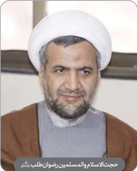
حجت‌الاسلام والمسلمین رضوان طلب رحمته‌الله