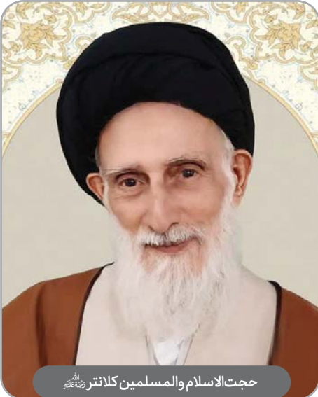
حجت‌الاسلام والمسلمین کلانتر رحمته‌الله