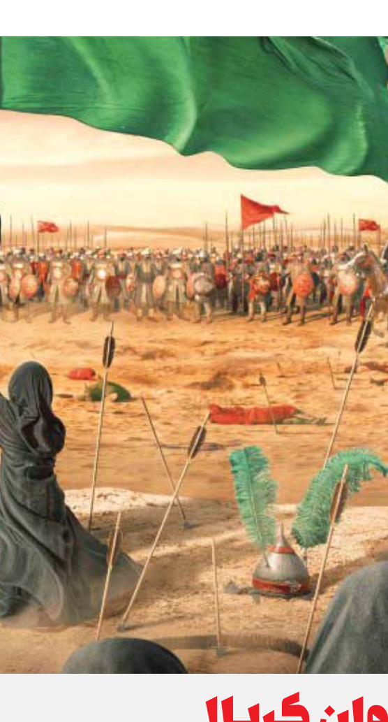
نقاشی از واقعه کربلا، اثر علی‌اکبر دهخدا

از سوی دیگر، دشمنان سر وهب را برای شکنجه مادر، به سوی آن پیرزن شجاع پرتاب کردند. این مادر صبر و ایثار، سر جوانش را بوسید و گفت: «سپاس خداوندی را که با شهادت تو در رکاب امام حسین (عجته) مرا روپسید کرد.» سپس سر وهب را به سوی دشمن پرتاب کرد و گفت: «آن سرا که برای دوست داده‌ایم، باز نمی‌ستانیم.» و ستون خیمه را برداشت و به دشمن حمله کرد و دو نفر از سپاه سپاه عمرسعد را به هلاکت رساند. امام (عجته) او را به خیمه برگرداند و برای او دعا کرد و مژده بهشت داد. ام‌وهب با شادی تمام از امر امام خویش اطاعت کرد و هنگام بازگشت گفت: «خدا!ا امید بهشت را از من بگیر.» ۲ نکته قابل توجه این است که حمله به سوی دشمن، با عمود خیمه در مورد مادر عبدالله‌بن عمر نیز نقل شده است و به‌نقل تاریخ، حضرت اباعبدالله (عجته) او را به سوی خیمه‌اش بازگرداند. همچنین در مورد مادر