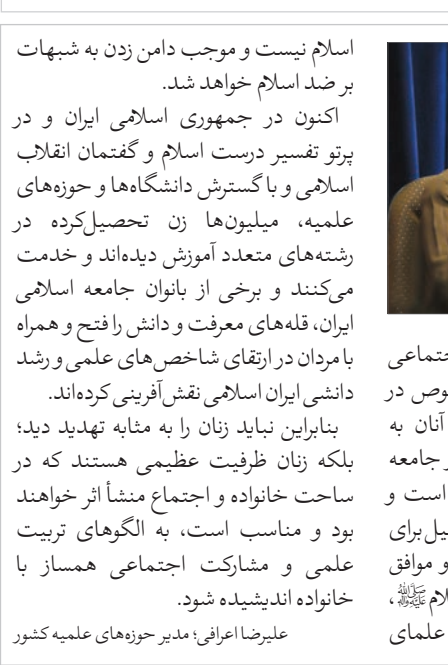
گزارش: رحیم کریمی

اسلام نیست و موجب دامن زدن به شبهات بر ضد اسلام خواهد شد. اکنون در جمهوری اسلامی ایران و در پرتو تفسیر درست اسلام و گفتمان انقلاب اسلامی و با گسترش دانشگاه‌ها و حوزه‌های علمیه، میلیون‌ها زن تحصیل‌کرده در رشته‌های متعدد آموزش دیده‌اند و خدمت می‌کنند و برخی از بانوان جامعه اسلامی ایران، قله‌های معرفت و دانش را فتح و همراه با مردان در ارتقای شاخص‌های علمی و رشد دانشی ایران اسلامی نقش‌آفرینی کرده‌اند.