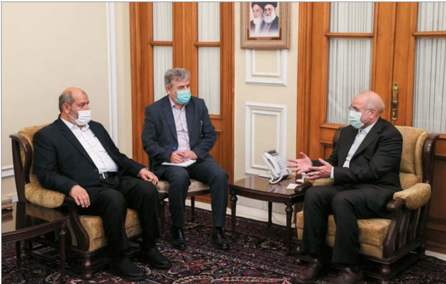
دکتر قالیباف در دیدار با عضو ارشد جنبش حماس