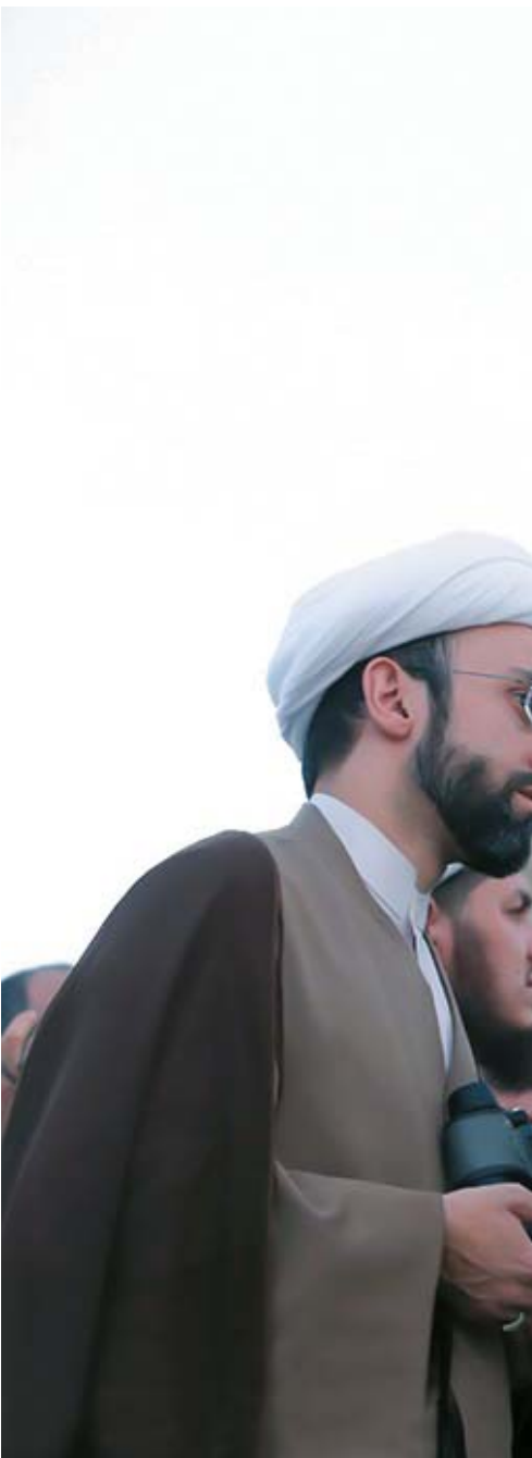
ادامه از صفحه قبل

۵۰. موضوع بحث ما در این مقال، صورتی است که هلال با چشم غیرمسلح به هیچ‌وجه قابل رؤیت نباشد هرچند هیچ مانعی مانند ابر و بخار وجود نداشته باشد. بنابراین اگر هلال به حدی برسد که لو لالمانع، با چشم عادی رؤیت شود، ولی بر اثر مانع فقط با تلسکوپ قابل رؤیت باشد، در اینجا مسلماً رؤیت با تلسکوپ معتبر است. در این فرض حتی اگر با تلسکوپ هم قابل رؤیت نباشد، ولی محاسبات علمی نشان دهد که ماه با چشم غیرمسلح رؤیت‌پذیر و قابل رؤیت است، همین کافی و معتبر است و با آن حلول ماه نو ثابت می‌شود؛ چه‌بسا برخی از کسانی که رؤیت با تلسکوپ را معتبر می‌دانند مقصودشان همین صورت باشد.