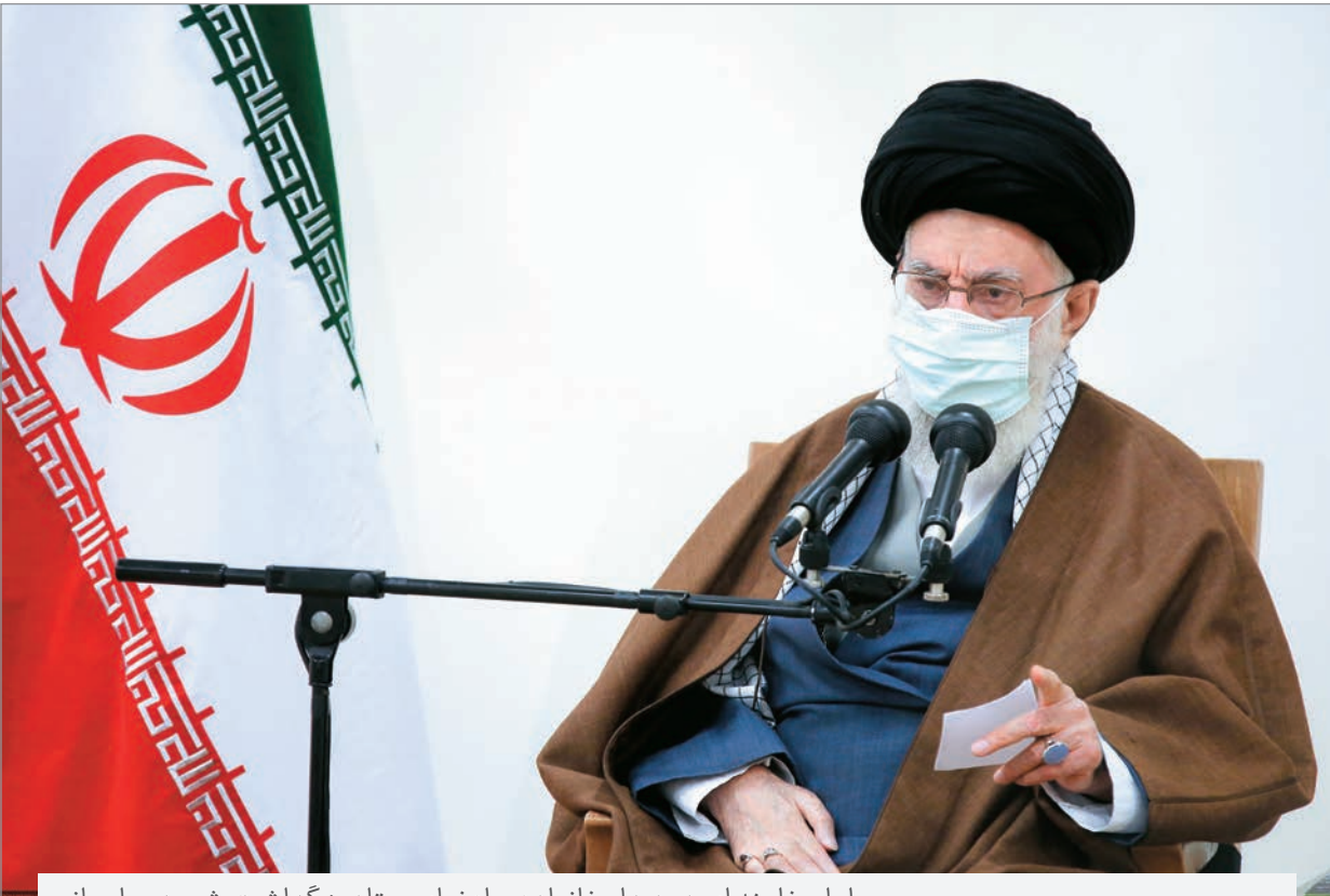
امام خامنه ای در دیدار خانواده و اعضای ستاد بزرگداشت شهید سلیمانی